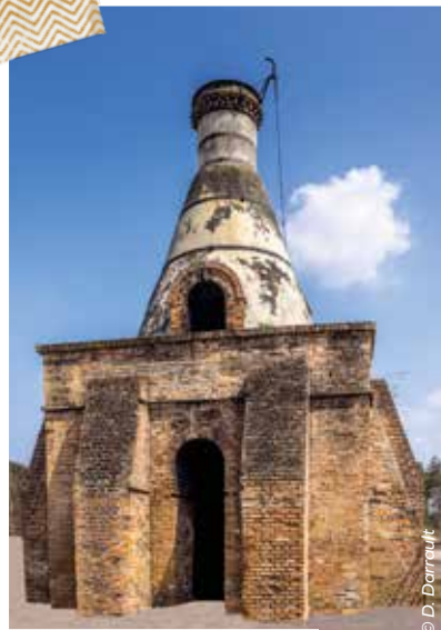
Briqueterie de Ligny-le-Ribault