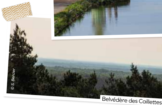
Belvédère des Caillettes