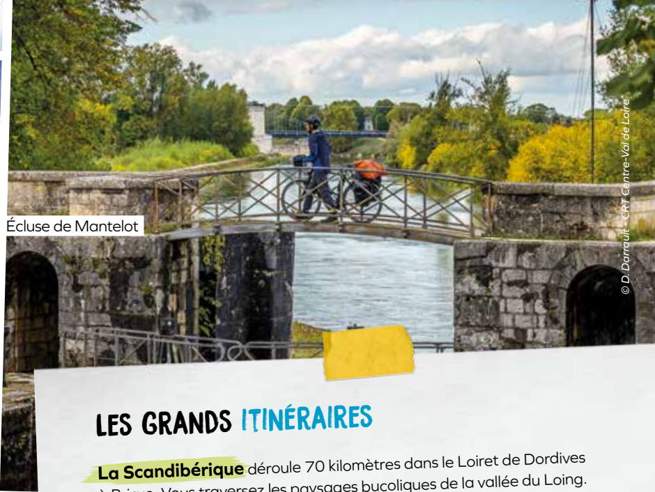
Écluse de Mantelot