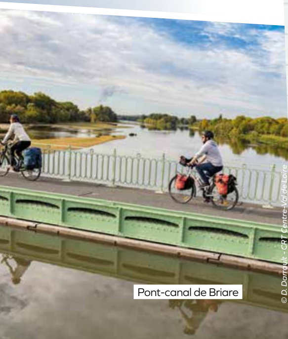
Pont-canal de Briare

LES + Montargis, la Venise du Gâtinais ; Rogny-les-Sept-Écluses (89) ; le pont-canal de Briare